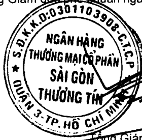
Tổng Giám Đốc