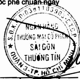
Tổng Giám Đốc