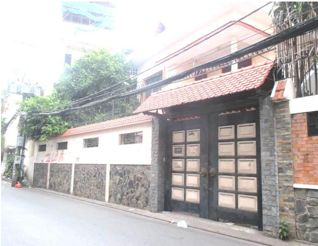
Mặt tiền tài sản

Lầu 13, Hội sở Sacombank, 266-268 Nam Kỳ Khởi Nghĩa, P.8, Q.3, Tp.HCM