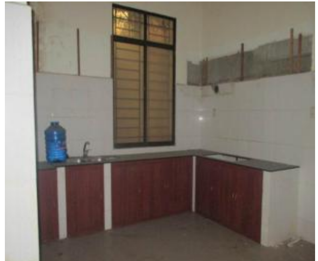
Bên trong tài sản