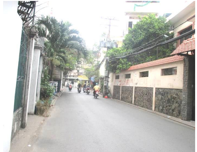
Hẻm tiếp giáp tài sản