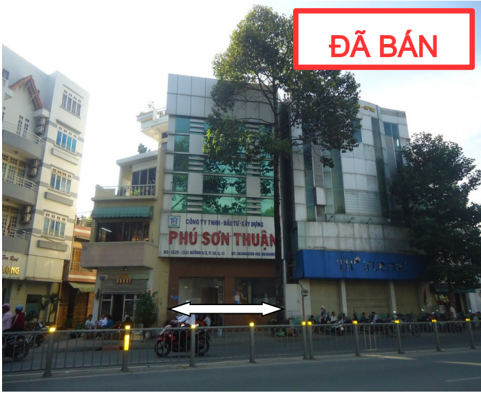
MẶT TIỀN TÀI SẢN