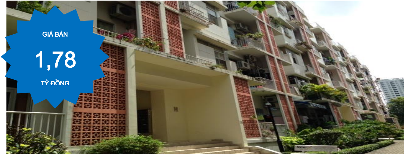
HÌNH ẢNH BÊN NGOÀI KHU HƯNG VƯỢNG