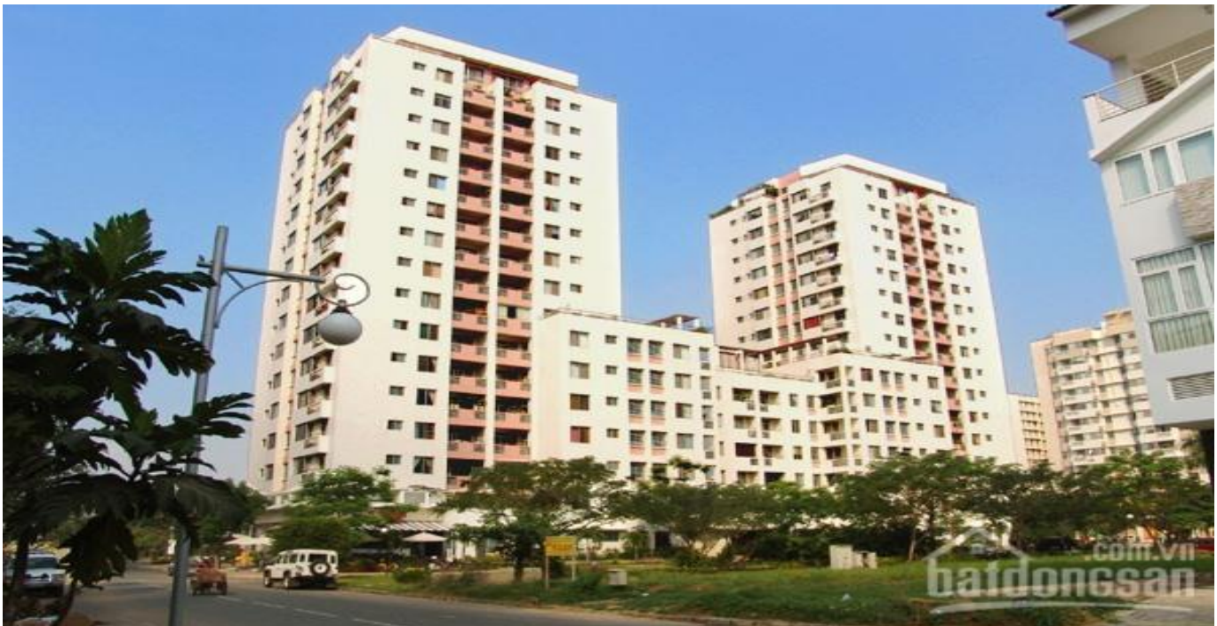
HÌNH ẢNH BÊN NGOÀI KHU HƯNG VƯỢNG