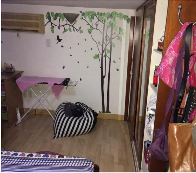
HÌNH ẢNH BÊN TRONG CĂN HỘ