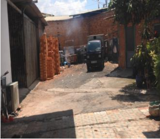
Phần đất nở hậu bên phải tài sản