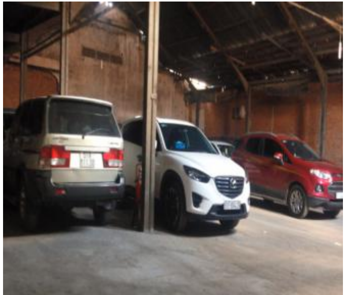
Nhà kho bên phải tài sản