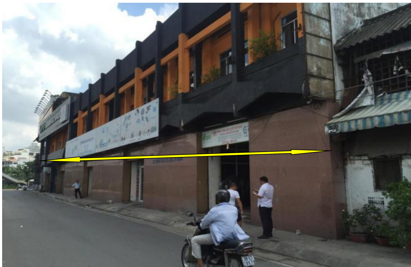
Mặt tiền tài sản