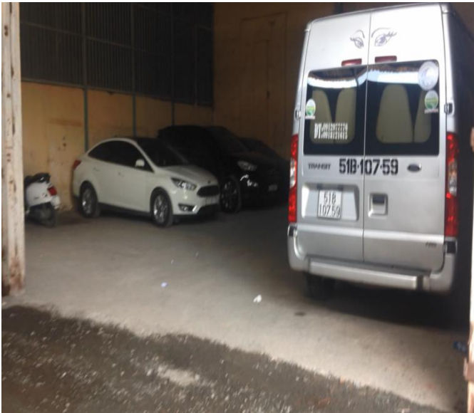
Nhà kho bên trái tài sản