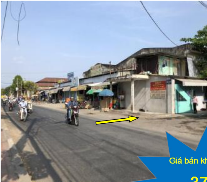
Mặt tiền tài sản