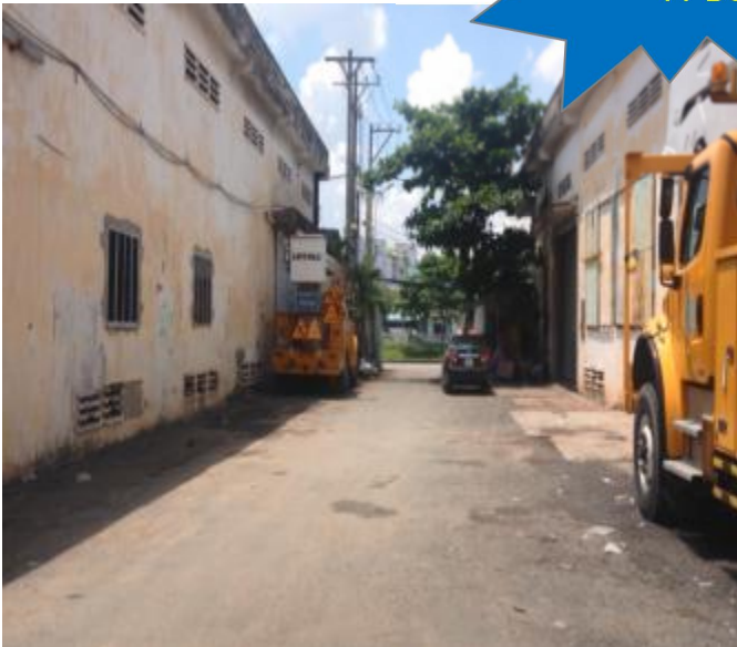
Đường nội bộ