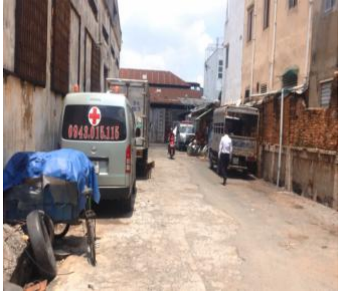
Đường nội bộ