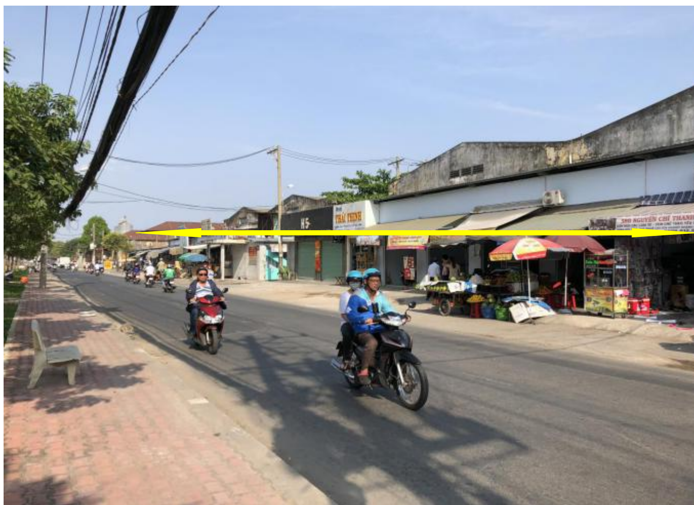
Mặt tiền tài sản