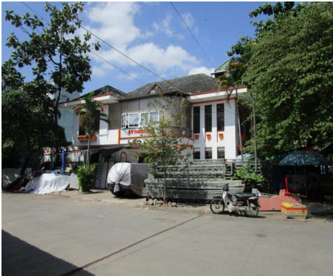
Khu nhà làm việc