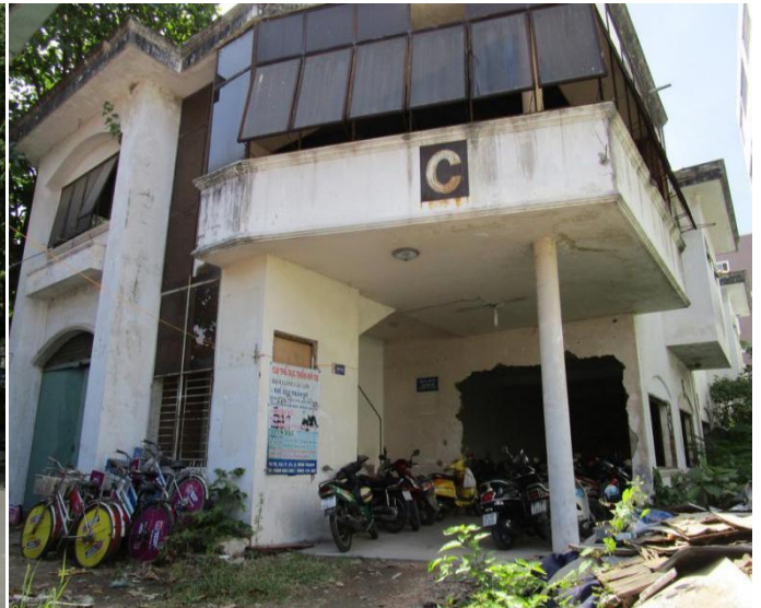
Nhà thiết kế mẫu