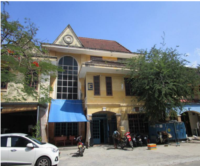
Khu nhà không được công nhận