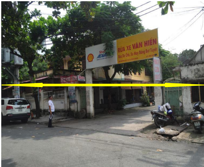
Mặt tiền tài sản