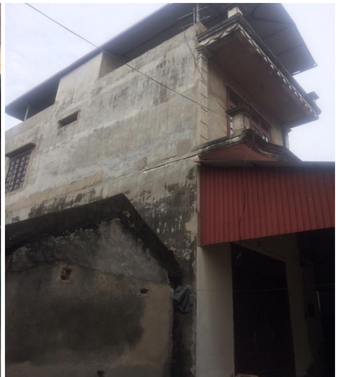
HÌNH ẢNH BÊN NGOÀI TÀI SẢN