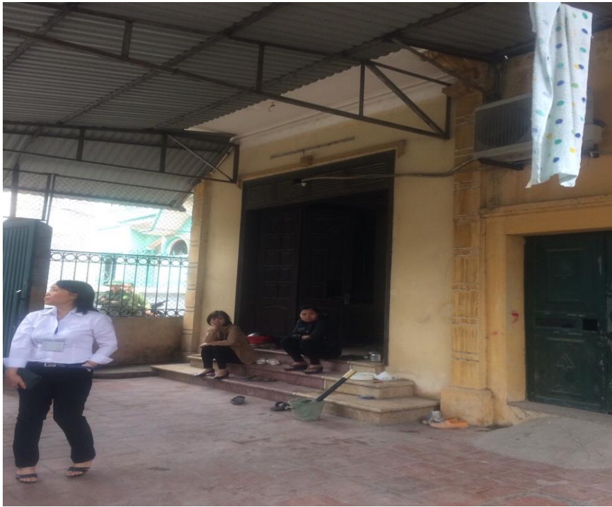
HÌNH ẢNH BÊN TRONG TÀI SẢN