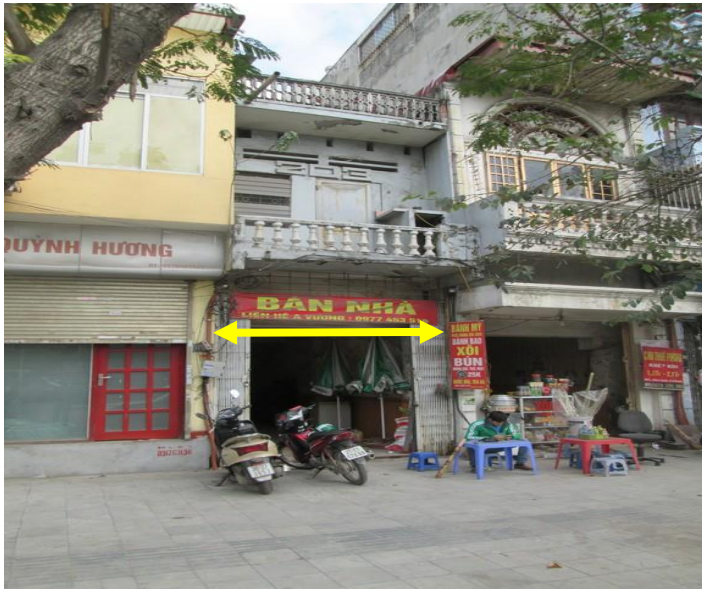
MẶT TIỀN TÀI SẢN