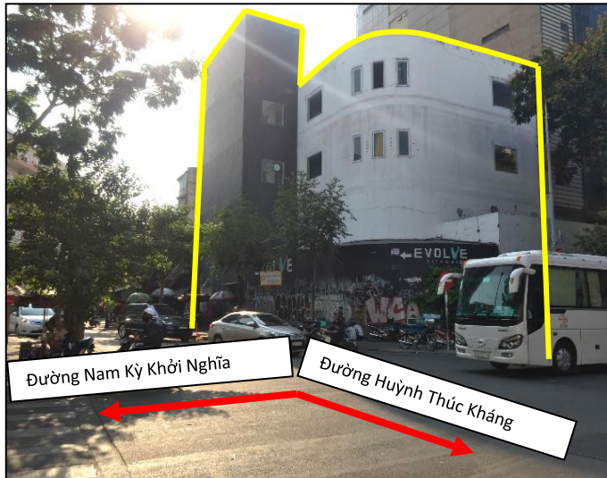
Hiện trạng tài sản 61 Nam Kỳ Khởi Nghĩa, phường Bến Thành, quận 1, TP HCM

BẤT ĐỘNG SẢN 61-63A NAM KỶ KHỞI NGHĨA, PHƯỜNG BẾN THÀNH, QUẬN 1, TP HCM