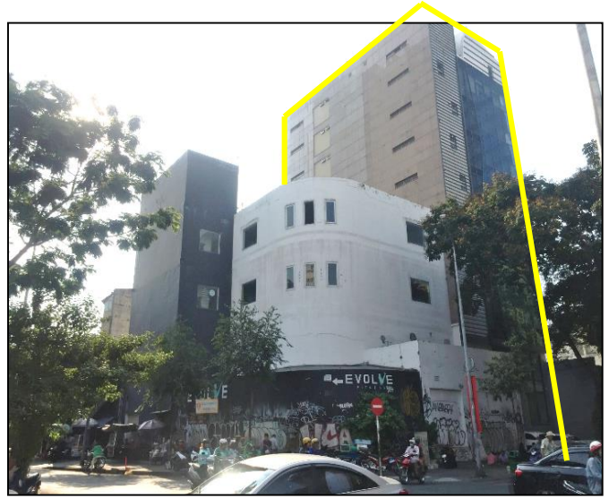
Hiện trạng tài sản 63A Nam Kỳ Khởi Nghĩa, phường Bến Thành, quận 1, TP HCM (9 tầng + hầm + tầng kỹ thuật)