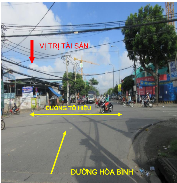
Góc mặt tiền đường Hòa Bình – Tô Hiệu