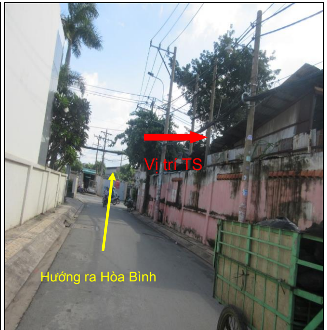
Hẻm bên hông tài sản – cạnh dự án Novaland