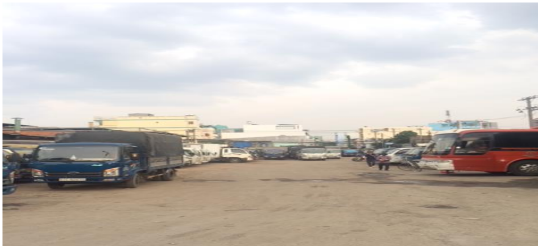
Hình ảnh bên trong tài sản