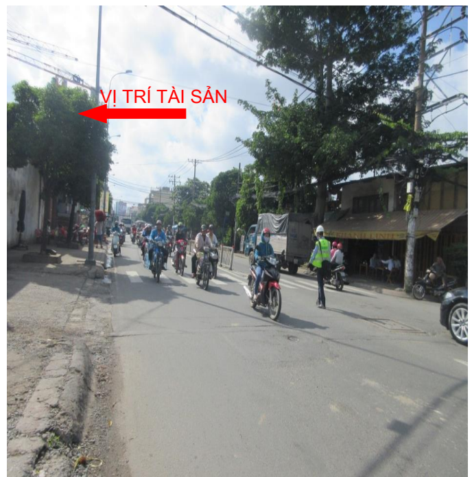
Mặt tiền đường Hòa Bình