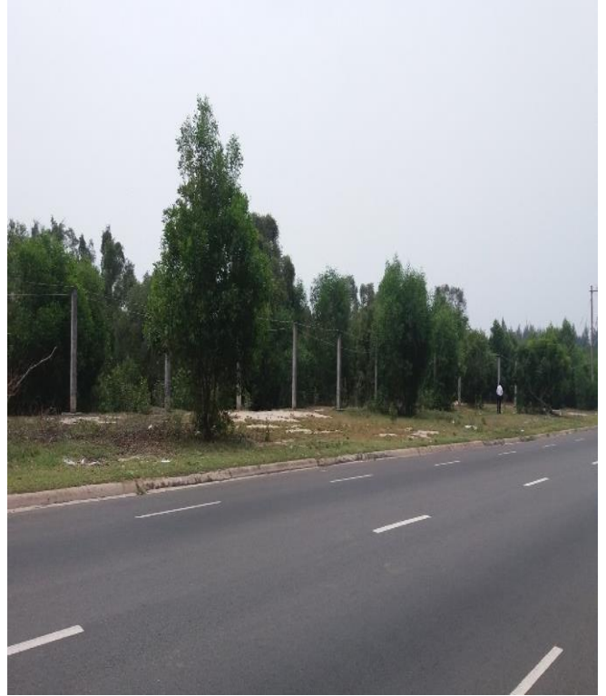
Tổng quan tài sản