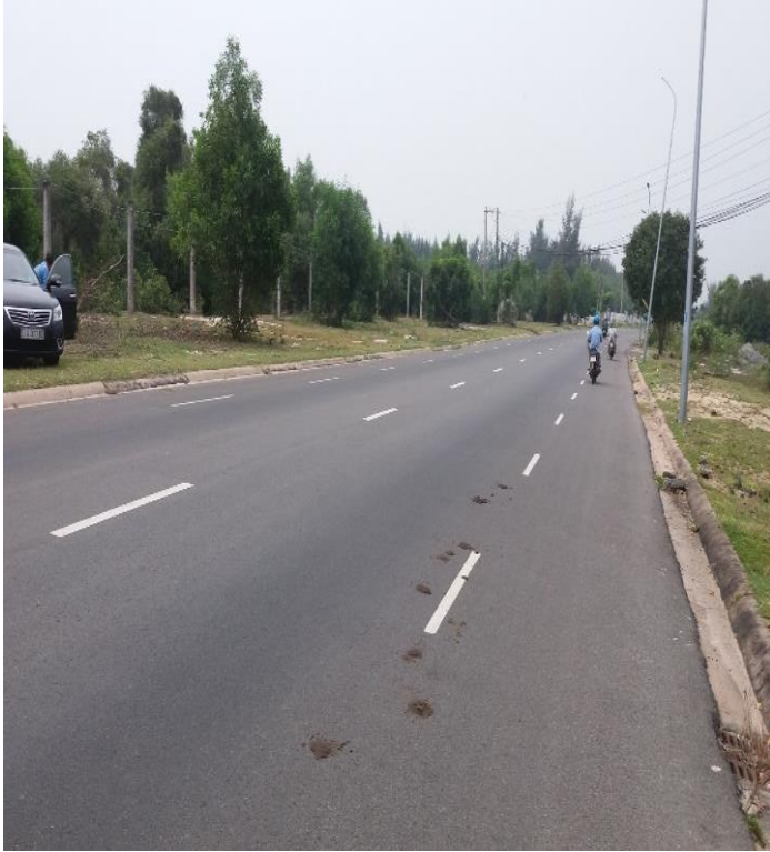
Đường ven biển Hồ Tràm

QUYỀN SỬ DỤNG ĐẤT TẠI THỬA SỐ 58, TỜ BẢN ĐỒ SỐ 08, TẠI XÃ PHƯỚC THUẬN, HUYỆN XUYỀN MỘC, TỈNH BÀ RỊA-VŨNG TÀU