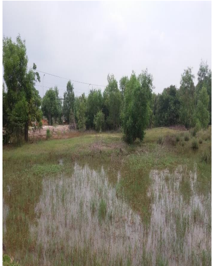
Hiện trạng tài sản