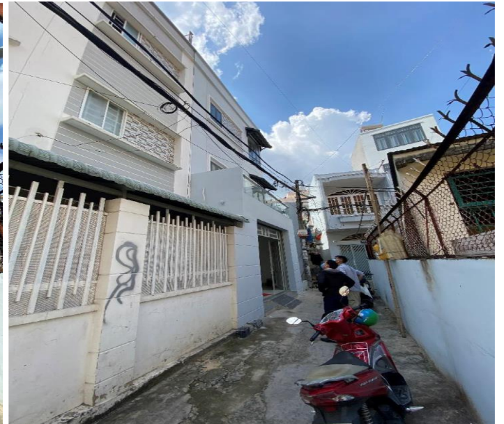
HÌNH TẦNG TRỆT + PHÒNG LẦU 1