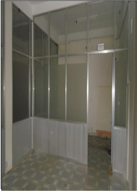
Bên trong tài sản