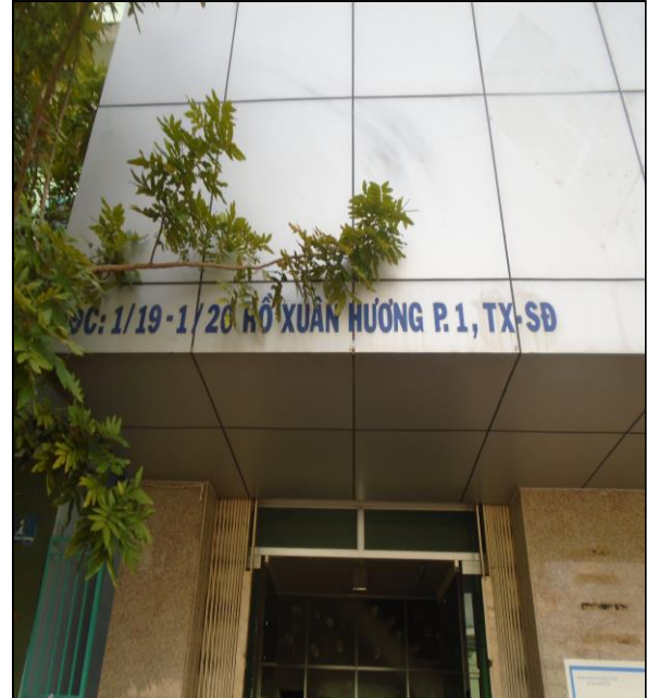
Mặt tiền tài sản