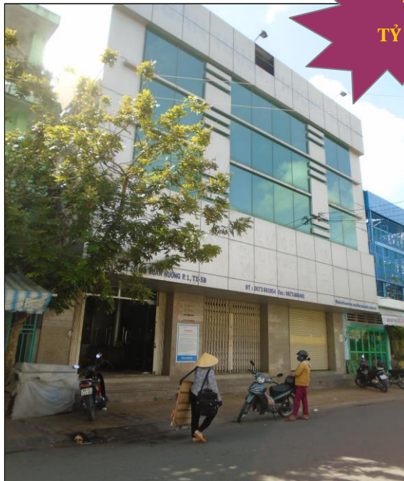
Mặt tiền tài sản