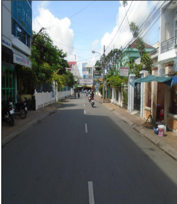
Đường phía trước tài sản

1/19 - 1/20 – 1/21 Hồ Xuân Hương, P1, Tp.Sa Đéc, Đồng Tháp