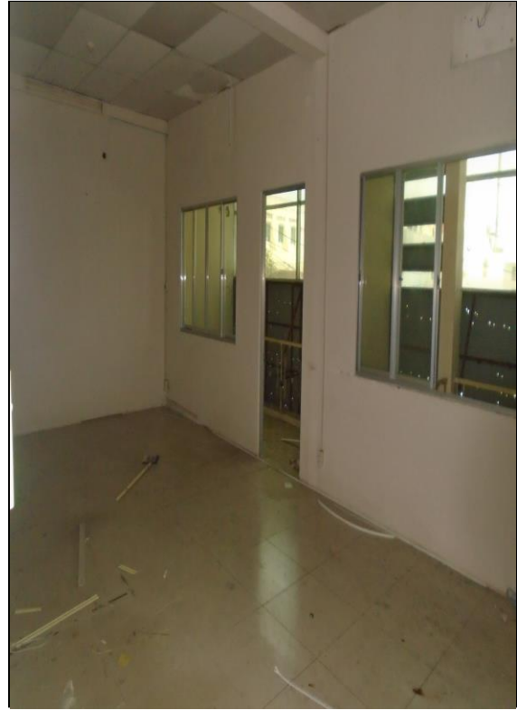
Bên trong tài sản