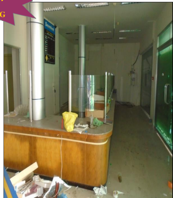
Bên trong tài sản