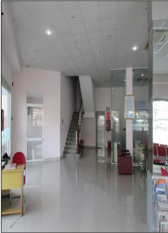
Bên trong tài sản