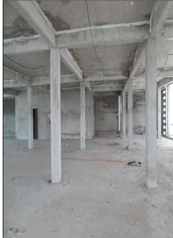
Bên trong tài sản