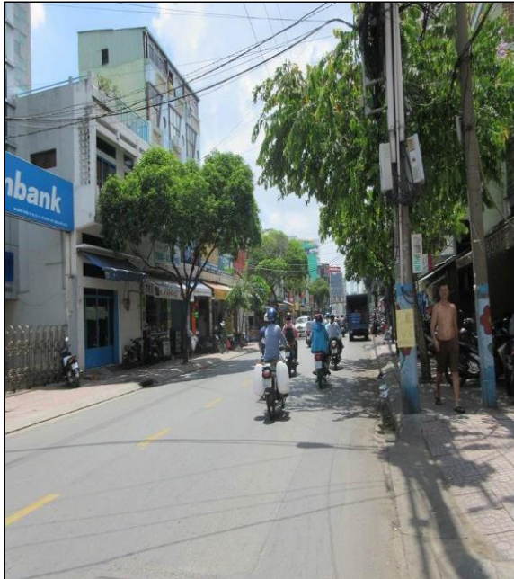
Đường phía trước tài sản

58 Bình Thới, phường 14, quận 11, Tp. HCM