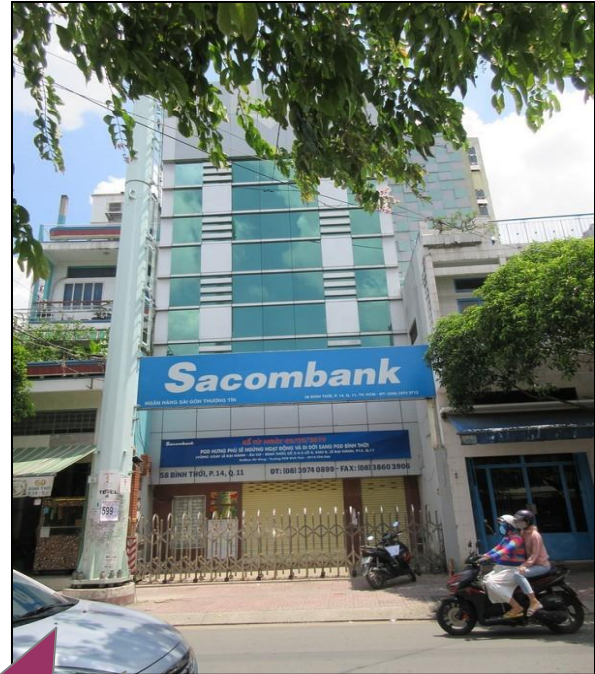
Mặt trước tài sản