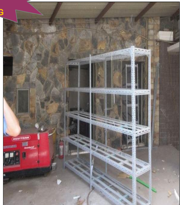
Bên trong tài sản