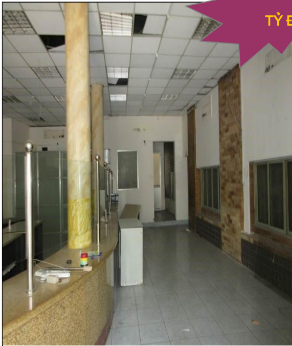
Bên trong tài sản