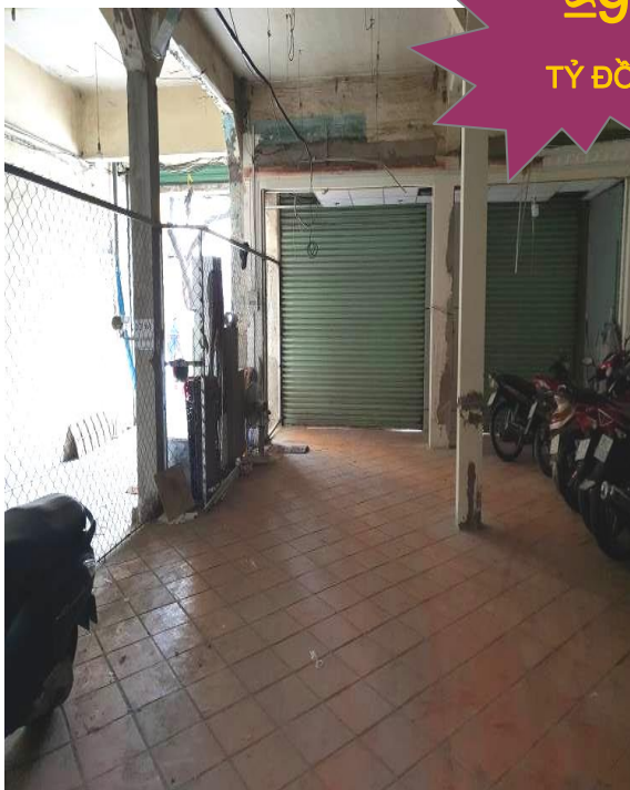
Bên trong tài sản