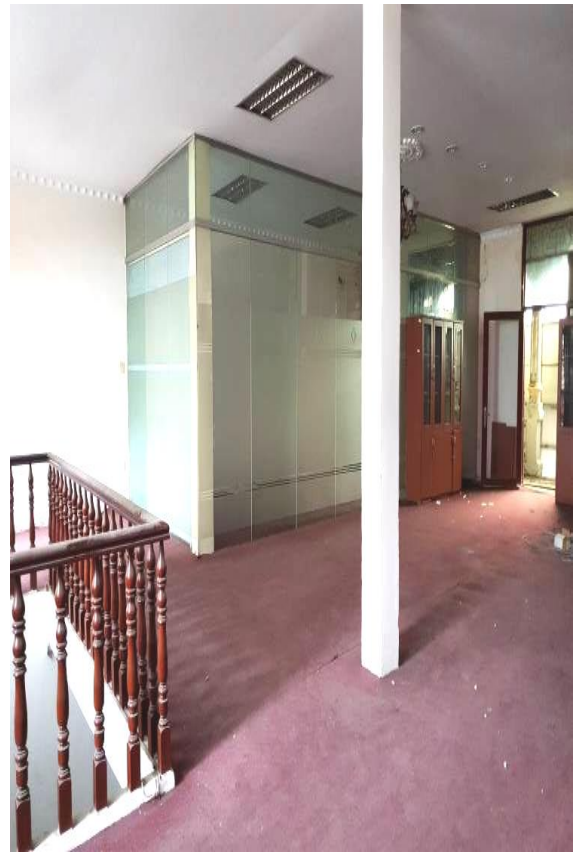
Bên trong tài sản