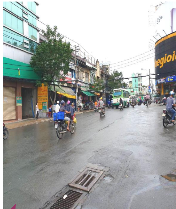
Đường phía trước tài sản