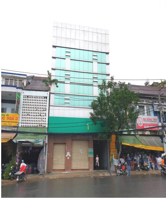
Mặt trước của tài sản

BDS 46 Lê Quang Sung, Phường 2, Quận 6, TP.HCM