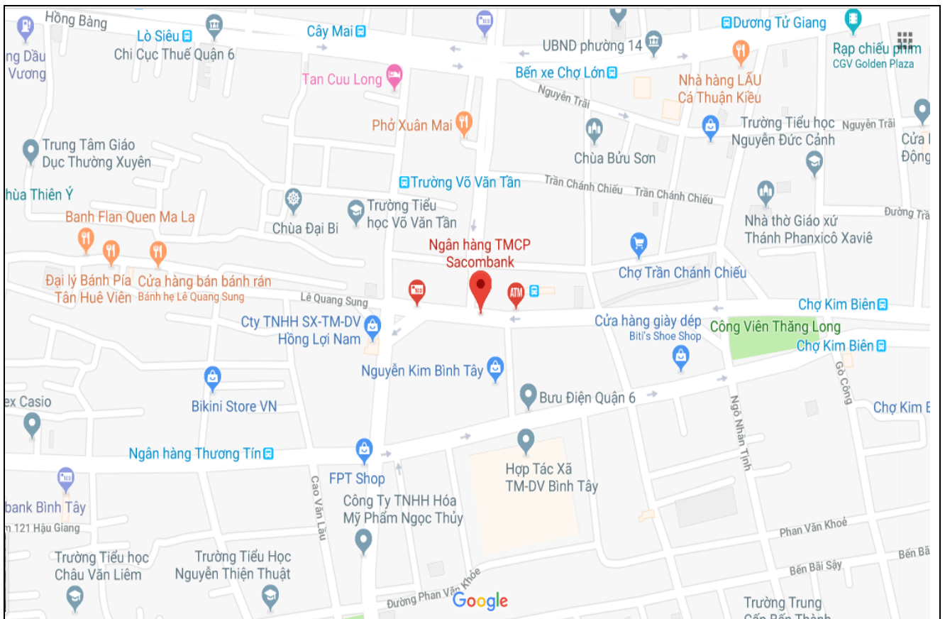
Vị trí tài sản