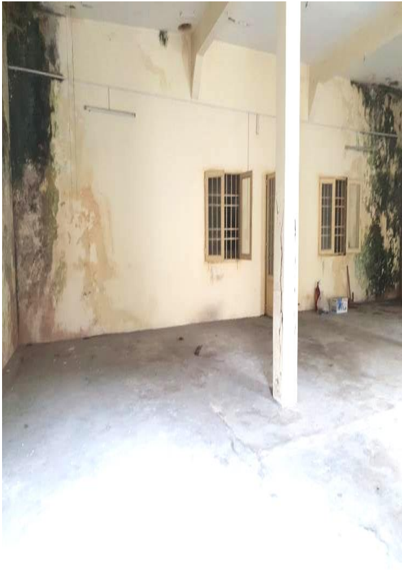
Bên trong tài sản