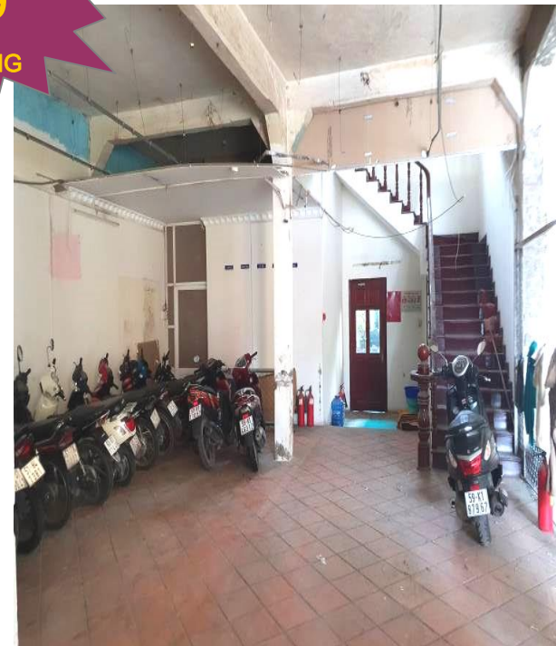
Bên trong tài sản