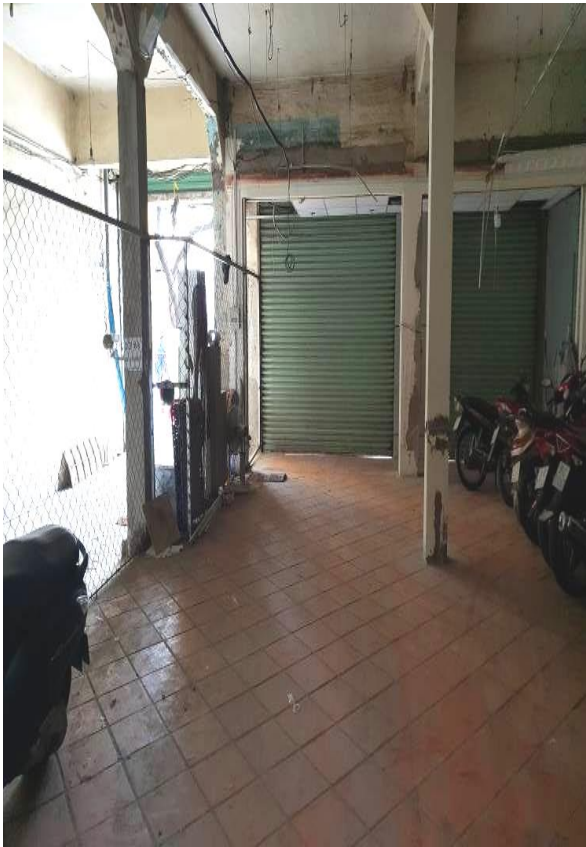
Bên trong tài sản