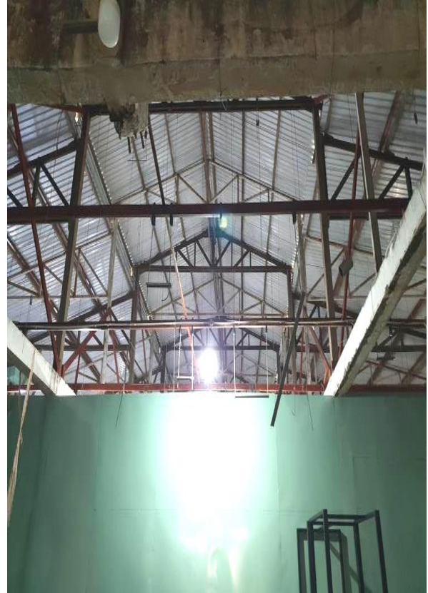
Bên trong tài sản