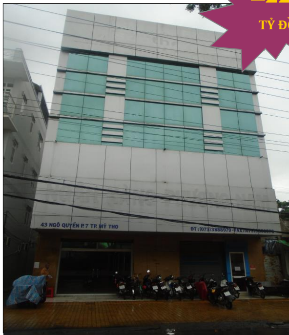
Mặt tiền tài sản