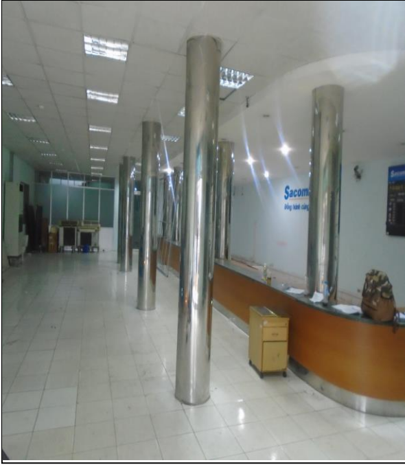
Bên trong tài sản