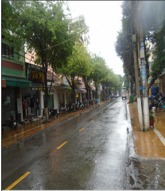
Đường phía trước tài sản

BDS tại: 43 Ngô Quyền, P.7, Tp. Mỹ Tho, T.Tiền Giang