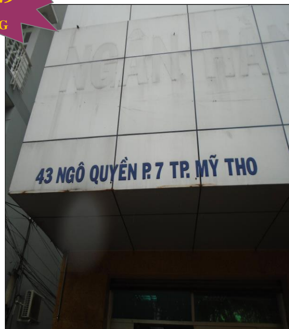
Mặt tiền tài sản