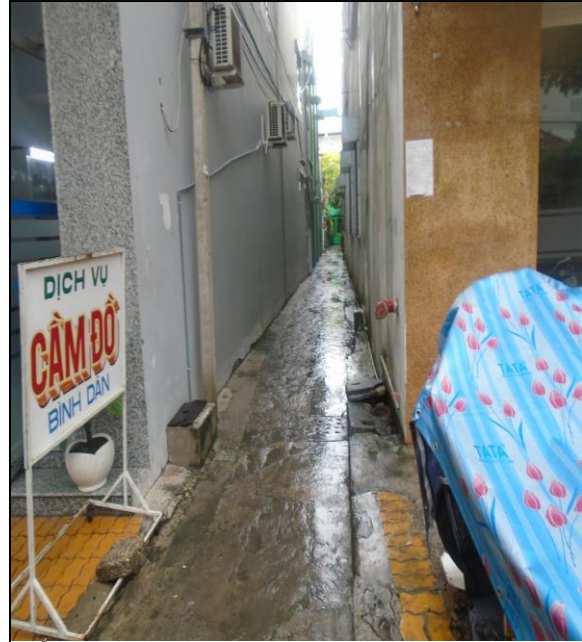
Đường hẻm bên hông tài sản