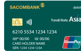
Thẻ quốc tế UnionPay

Quý khách có thể đăng ký nhiều hơn 1 thẻ thanh toán SACOMBANK hoặc đăng ký thêm thẻ phụ tại: