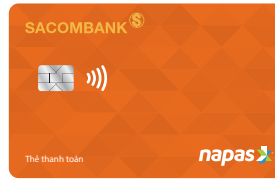
Thẻ thanh toán Napas